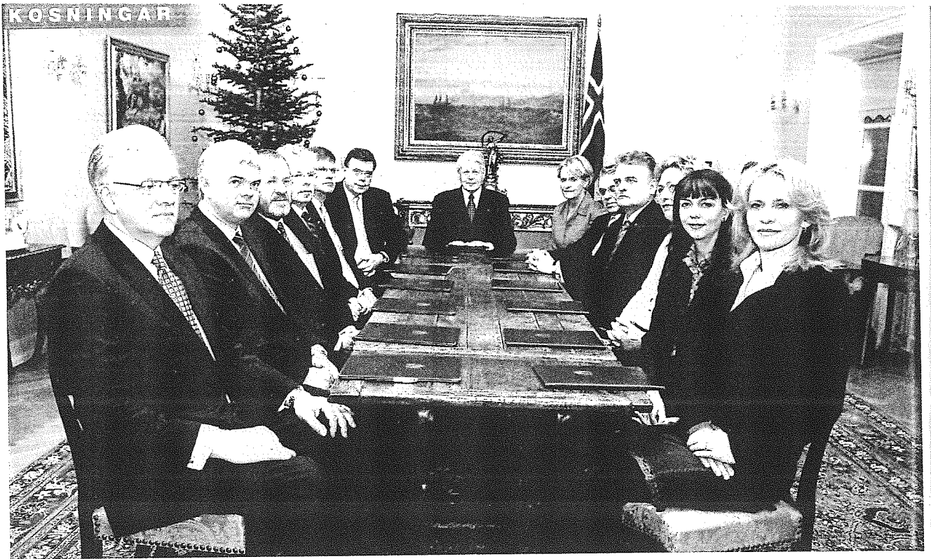
Ólafur Ragnar Grímsson. Forsetinn hefur enn ekki þurft að úthluta umboði til stjórnarmyndunar.